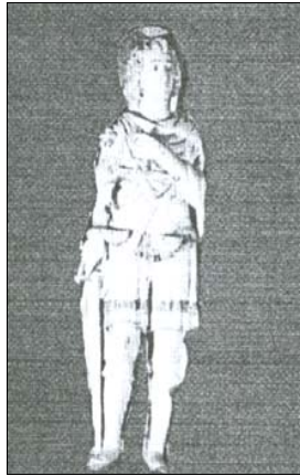
Arcangelo Michele – particolare da: Pala d'Altare Madonna in trono con Bambino e 4 santi - Chiesa di S. Michele Arcangelo di Badia Tedalda

S'accese guerra nel cielo; venendo Michele e i suoi angeli a combattere col dragone (Satana), entrò pure in guerra il dragone e i suoi angeli; ma questi non prevalsero e neppure ebbero più posto in cielo.